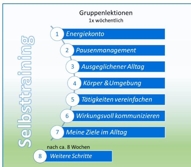
Ablauf ambulante Gruppen/ Tageskliniken

EMS ist eine Gruppenbehandlung, die von einem speziell ausgebildeten Ergotherapeuten bzw. einer Ergotherapeutin angeleitet wird. Sie wurde auf der Grundlage wissenschaftlichen Wissens entwickelt für Menschen mit Fatigue, die Erfahrung mit diesem Symptom in ihrem persönlichen Alltag haben. Die kognitiven und kommunikativen Fähigkeiten für eine Patientenedukation im Gruppensetting sollten gegeben und keine ausgeprägte Depression vorhanden sein.